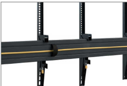
Kabelmanagement mittels Kabelclips