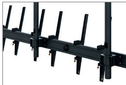
Anpassbar dank modularer Bauweise