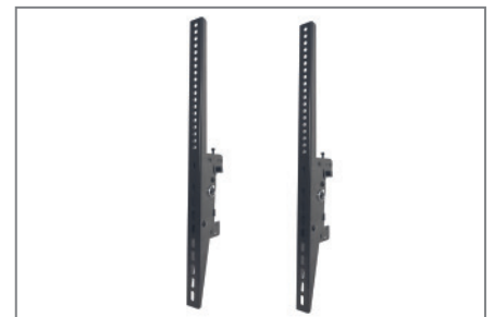
VESA max. 400 x 600 mm